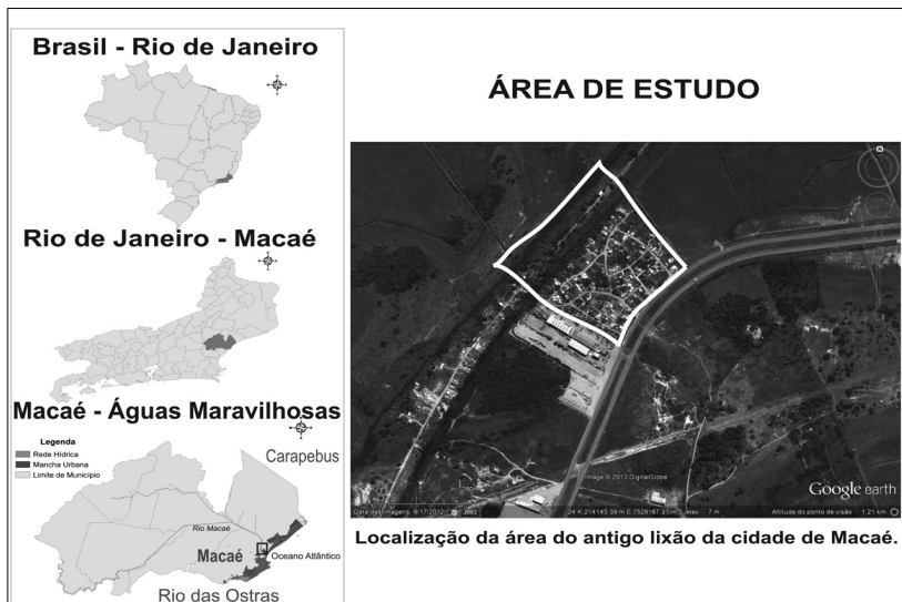
FIGURA 1 – Águas Maravilhosas. Fonte: Plano Local de Habitação de Interesse Social, Prefeitura de Macaé e Google Earth, 2012. Elaboração própria

mas clássicos, como contaminação do lençol freático. A história do lixão de Macaé é um exemplo de irresponsabilidade administrativa e medidas semelhantes vêm sendo realizadas por inúmeras prefeituras. Assim, não é um problema local, pois ocorreu em diversas regiões, conforme apresentado em outros trabalhos (SHIRAIWA, 2002; SILVA et al. , 2002; GIATTI et al. , 2010).